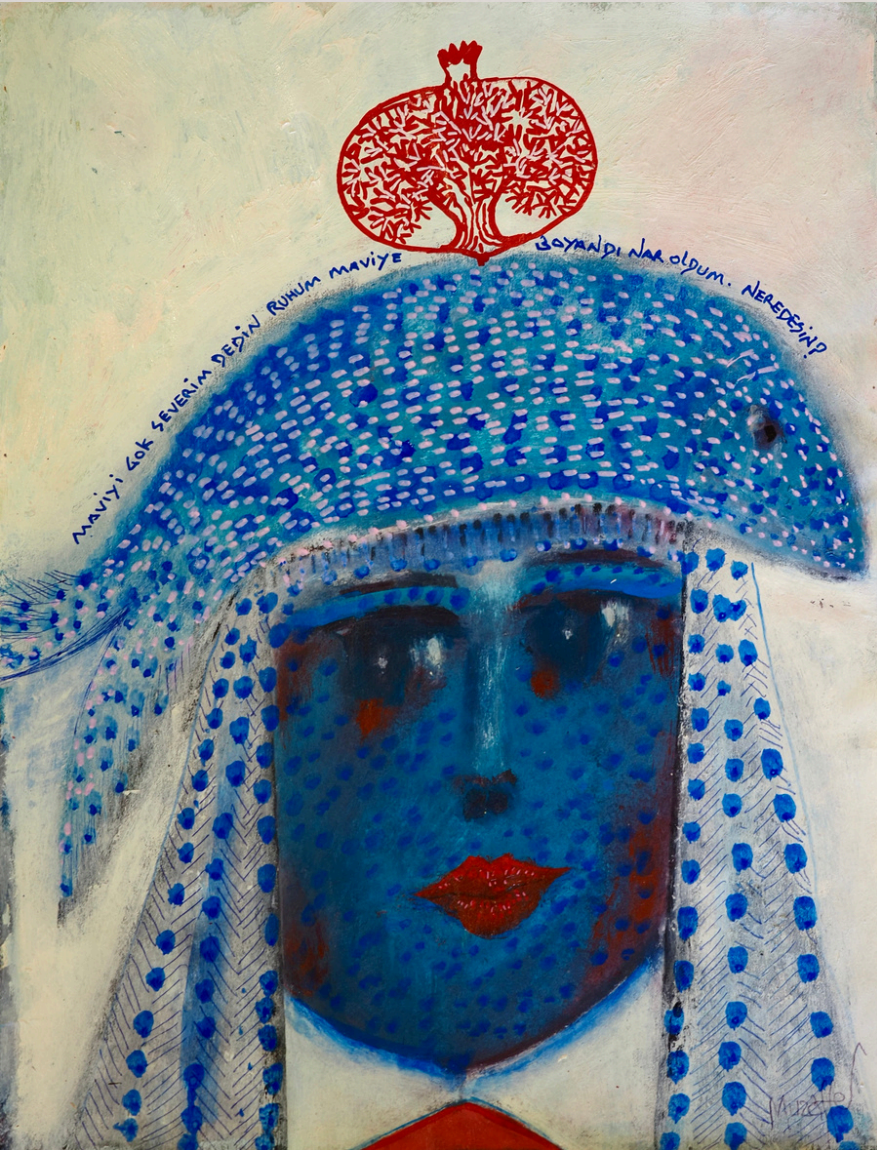
MAVİ NİN GÜCÜ NAR'IN GİZEMİ