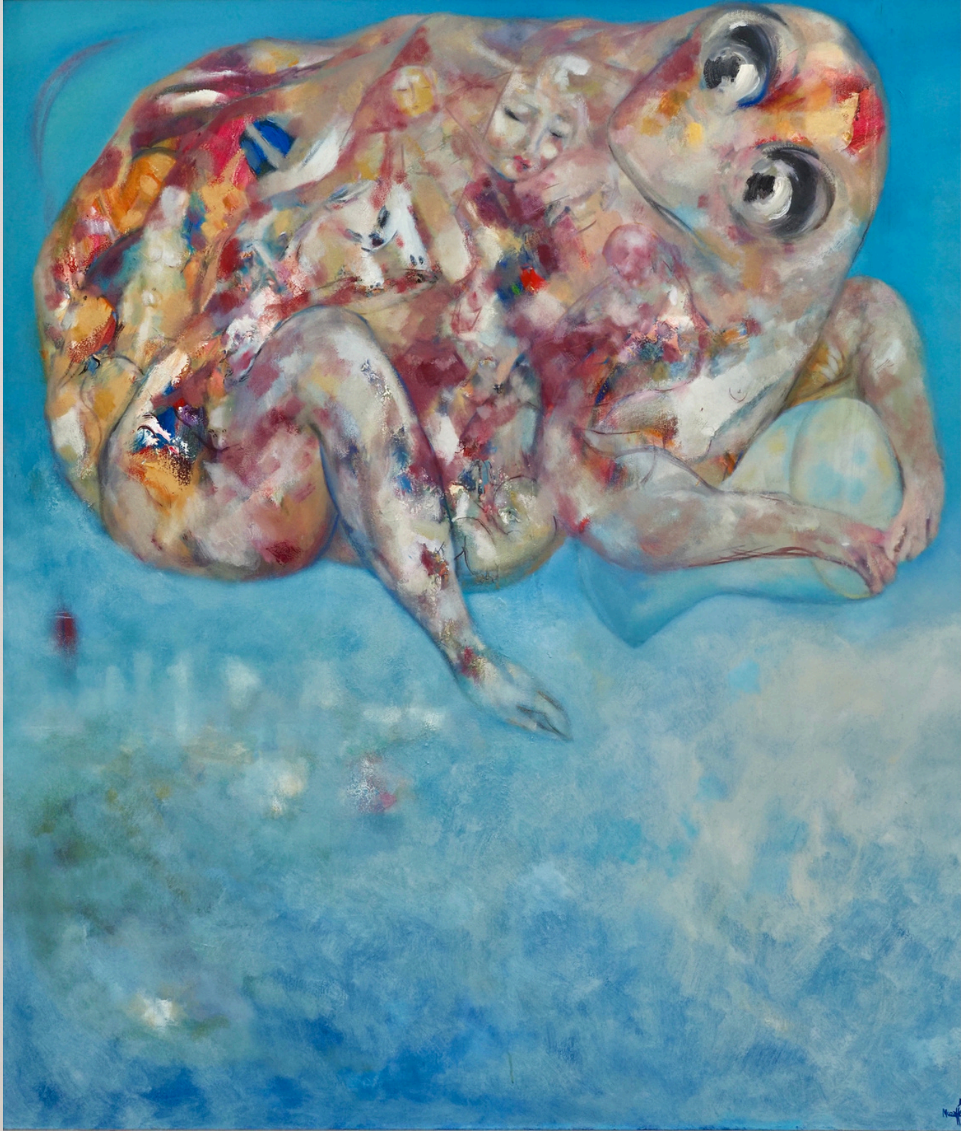
BOŞLUĞA DARBUKA / ALANKURBAĞA TUVAL ÜZERİ YAĞLI BOYA 140 X 160 CM 2001