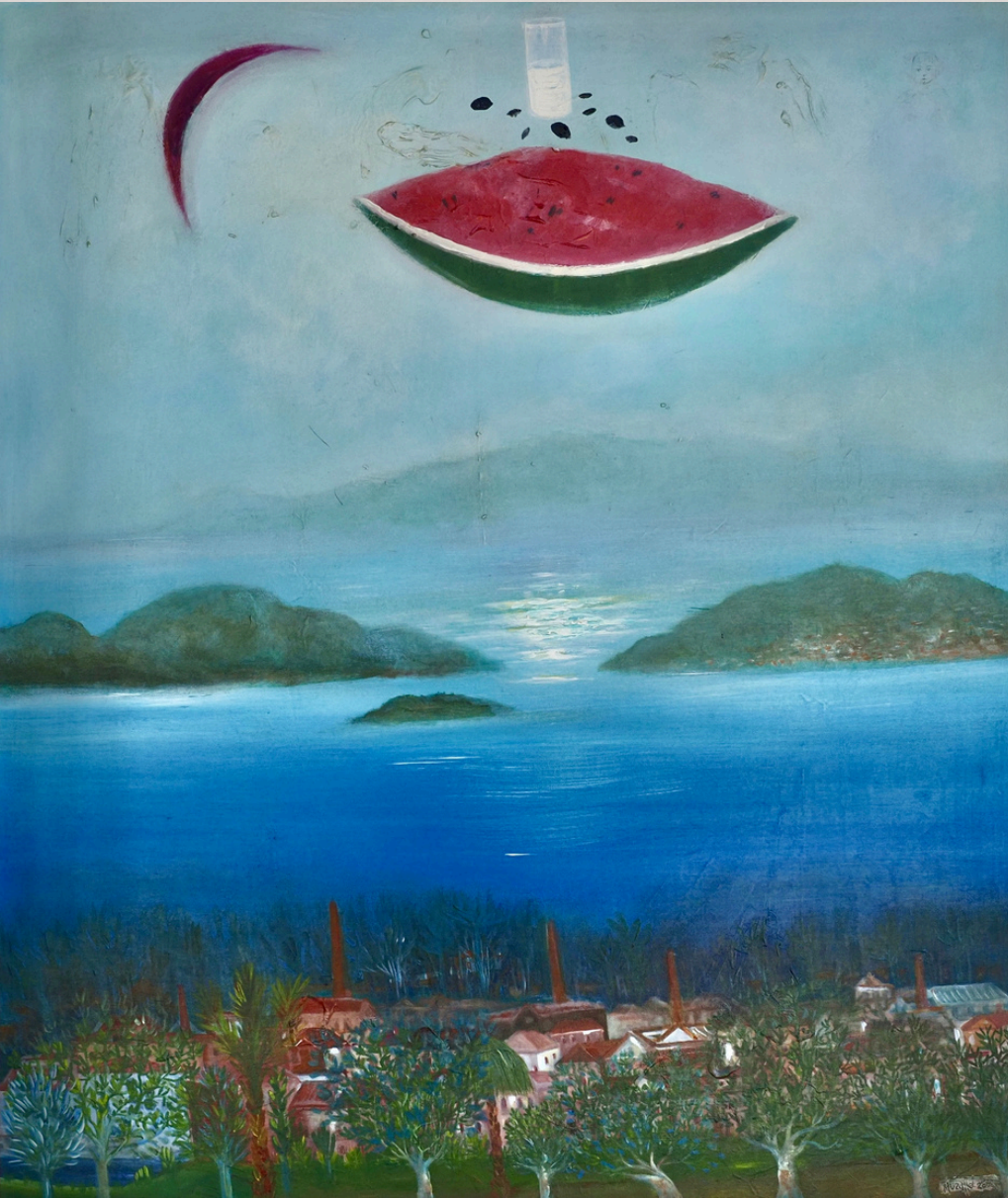
TUNCEL KURTİZ'LE CUNDA AKŞAMLARI