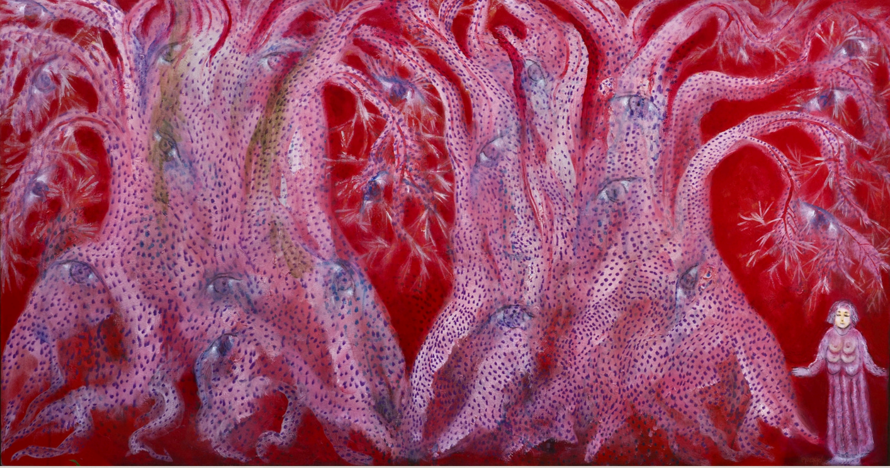
İKİ EZELİ VE EBEDİ AŞKIN KUCAKLAŞMASI

TUVAL ÜZERİ AKRİLİK 90 X 170 CM 2022 (BODRUM)