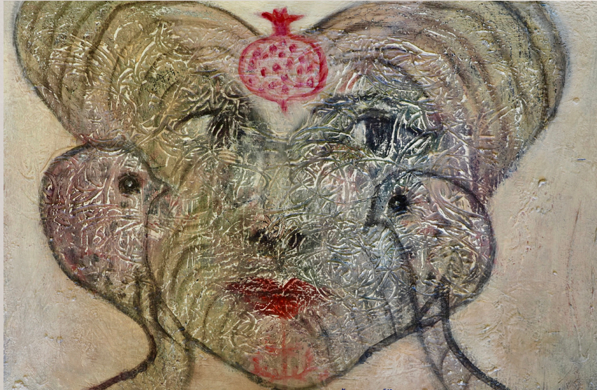
AŞK: A DAVET VE AİTŞ SÖYÄ DİĞER, SÜ SEVİNİR AİTŞ SÖNER DURALTI ÜZERİ AKRİLİK 50 X 70 CM 2024

TUVAL ÜZERİ AKRİLİK 90 X 170 CM 2022 (BODRUM)